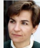
Christiana Figueres, Member, CDM Executive Board